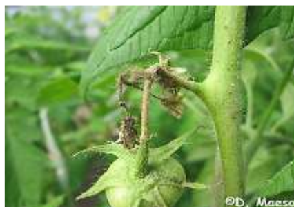
Simptome pe inflorescenta