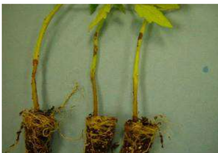
Cancere pe tulpini