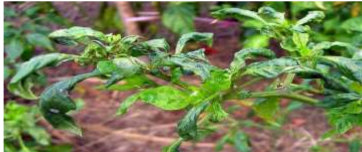
Atac pe tomate