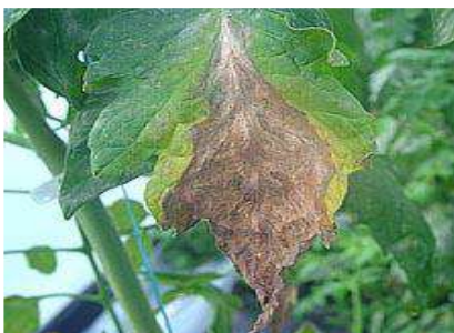
Leziuni pe frunze

Un simptom neobișnuit, pe fructe, îl reprezintă apariția de halouri, numite “pete fantomă”. În centrul acestor halouri apar puncte mici, necrotice. Haloul este de culoare albă, circular, de 3-8 mm în diametru. Un număr mare de halouri pe fructe face ca acestea să aibă un aspect neplăcut și să fie greu de comercializat.