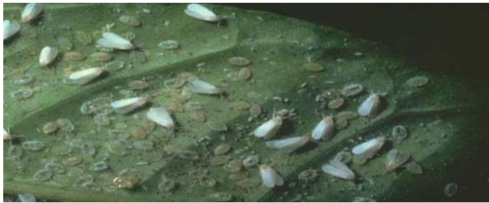
Musculița albă de seră în diferite stadii de dezvoltare