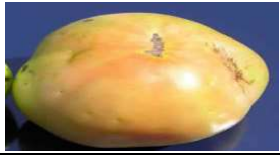
Atac pe fruct