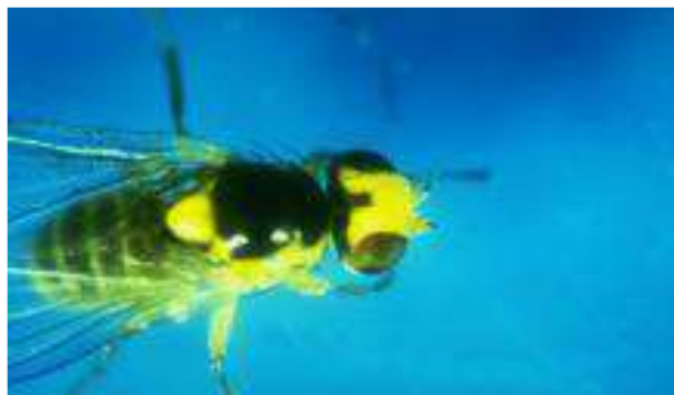
Adult ( femela)