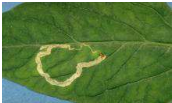
Atac pe frunza