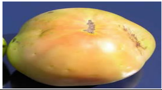
Atac pe fruct