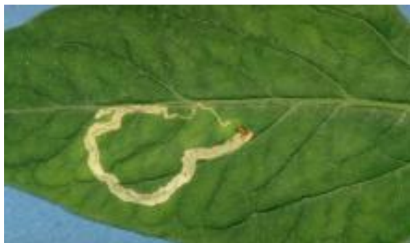
Atac pe frunza