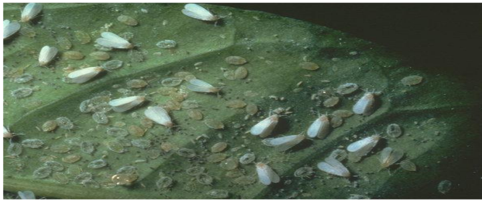
Musculița albă de seră în diferite stadii de dezvoltare