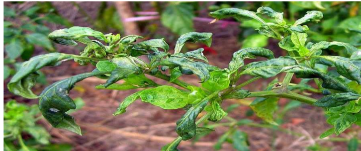
Atac pe tomate