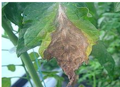
Leziuni pe frunze

Un simptom neobișnuit, pe fructe, îl reprezintă apariția de halouri, numite “pete fantomă”. În centrul acestor halouri apar puncte mici, necrotice. Haloul este de culoare albă, circular, de 3-8 mm în diametru. Un număr mare de halouri pe fructe face ca acestea să aibă un aspect neplăcut și să fie greu de comercializat.