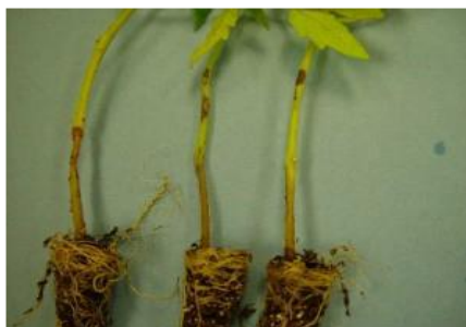
Cancere pe tulpini