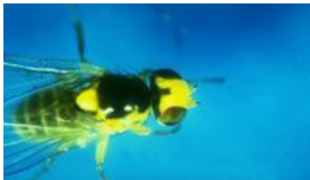
Adult ( femela)