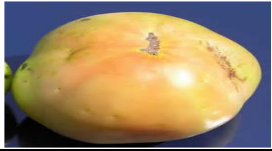
Atac pe fruct