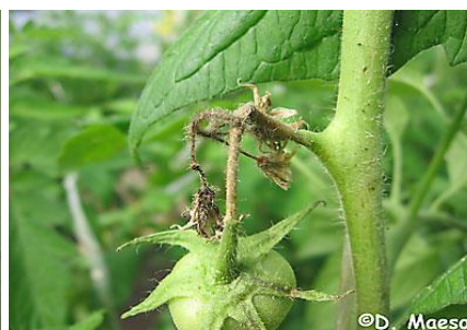
Simptome pe inflorescena